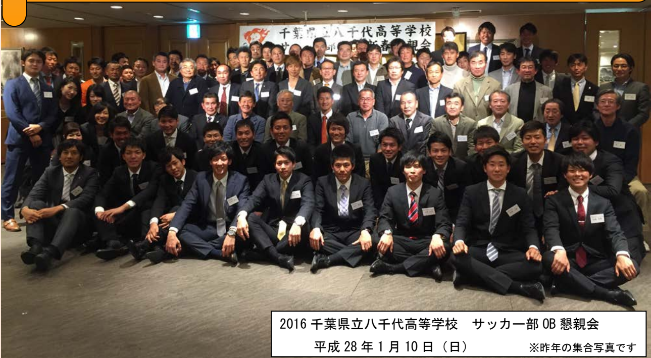
2016 千葉県立八千代高等学校 サッカー部OB 懇親会