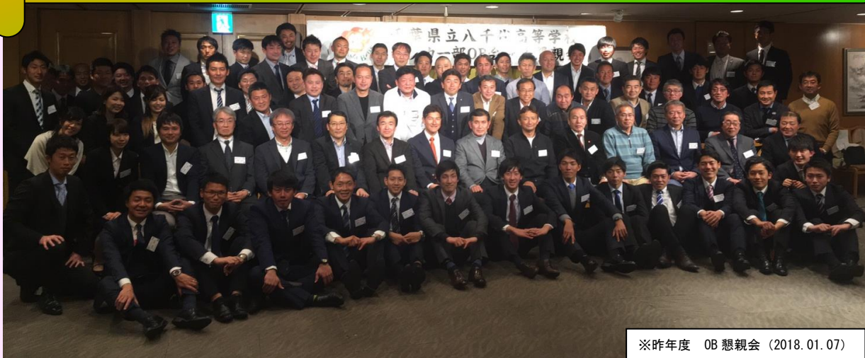
※昨年度 OB 懇親会 (2018. 01. 07)